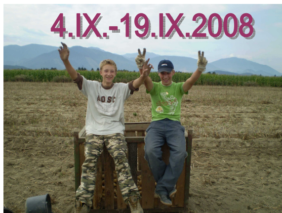
Odborná prax a odborný výcvik v rámci zemiacových brigád na PD Hybe, ktorá s prestávkami kvôli zlému počasiu trvala od 4.IX. – 19.IX.2008 / 1.PV, 2.PV, 1.AM, 2.AM, 1.AŽP, 2.AŽP, / / 3.AŽP, 4.AŽP, /