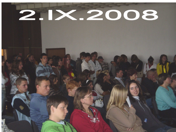
Slávnostné otvorenie školského roka Celkový počet študentov 357 Z toho dievčat 133