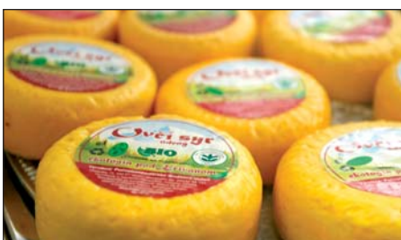
V produktoch z ovčieho mlieka vidí podnik veľký potenciál