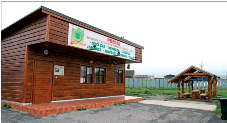
Syráreň a obchod – nádejná investícia za 80 tis. EUR