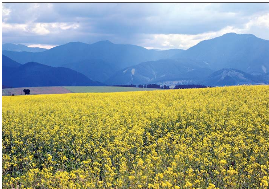
Repka je nosnou plodinou podniku. Na severe sa jej darí, má tu menej škodcov.