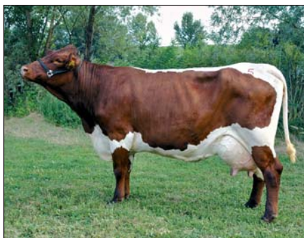
Dojnica ocenená Slovenským CHOV-om ako NAJKrajšie zviera výstavy AX 2008.