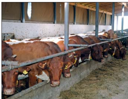
Pravdepodobne najväčšia génová rezerva pinzgauzskeho dobytku na svete.