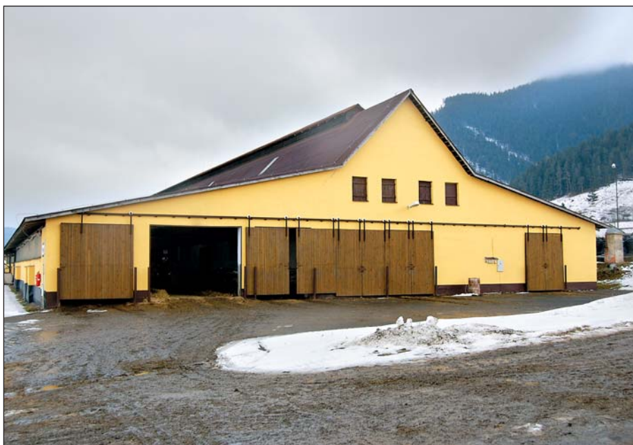
Zrekonštruovaná maštaľ pre génovú rezervu pinzgauského dobytká.

odmietame“ hovorí predseda. V snahe zlepšiť svoju vyjednávaciu pozíciu sa AGRIA podieľala na založení celkovo 3 odbytových združení – na predaj repky olejky (uvedené vyššie), hustosiatych obilnín a najnovšie i mlieka. Vďaka nim sa im darí byť o niečo silnejší pri rokovaniach.