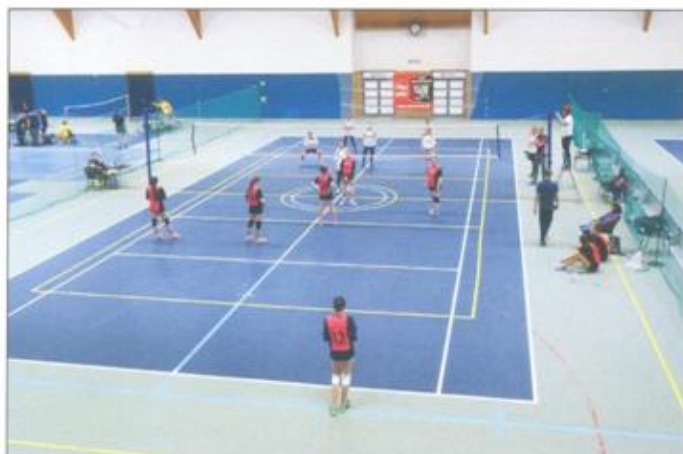
Vo volejbale zas dievčatá.