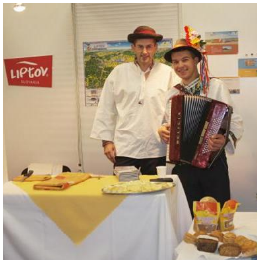
NAJORIGINAL- NEJŠI VÝSTAVNÝ STÁNOK

MAJSTERKA SR 2016 WESTERN PLEASURE OPEN 30.9.- 2.10.2016 GALANTA