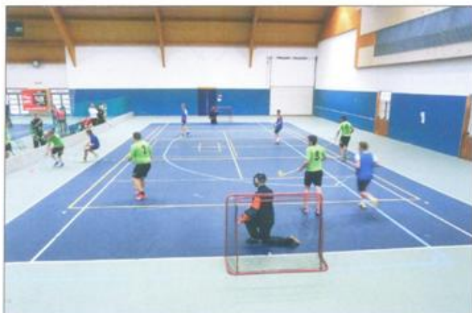
Vo florbale súťažili chlapci.

Ing. Tíbor Hugáň SOŠ polytechnická Liptovský Mikuláš