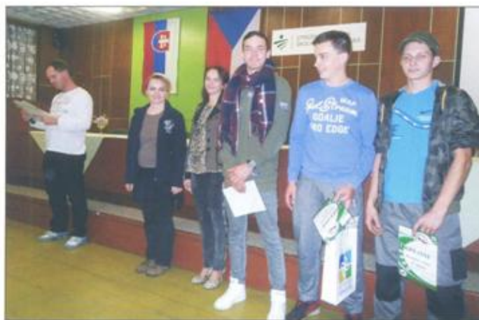
Naše víťazné družstvo v jazde zručnosti.

medzi zúčastnenými školami, spoznávanie súčasného stavu na školách, ale aj umožňuje zoznamovať sa s miestom konania súťaže a jeho okolím. V tomto kole Interligy sa mohli jej účastníci zúčastniť sprievodnej akcie, ktorá mala názov Zatváranie Demänovky. Samozrejme, že kontakty medzi školami sú aj mimo Interligy. Naposledy sa zástupcovia účastníckych škôl Interligy stretli na oslavách 150. výročia vzniku Střední školy technické a zemědělské Nový Jičín. O tom, že aj takáto forma spolupráce dokáže udržiavať priateľstvo medzi občanmi dvoch štátov, ktoré majú kus spoločnej histórie netreba snáď nikoho presviedčať a je potešujúce, že sa jej dostáva primeraná pozornosť aj zo strany vedúcich predstaviteľov miest, kde sa koná. Preto všetky zúčastnené školy majú záujem v jej pokračovaní aj po ukončení VI. ročníka Interligy, ktoré vyvrcholí finálovým štvrtým kolom v Rožnově pod Radhoštěm.