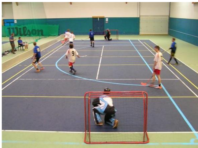
ILUSTRÁČNÉ FOTO : 22.IV.2016 FINÁLE V. ROČNÍKA INTERLIGY, SOŠ LIPTOVSKÝ MIKULÁŠ