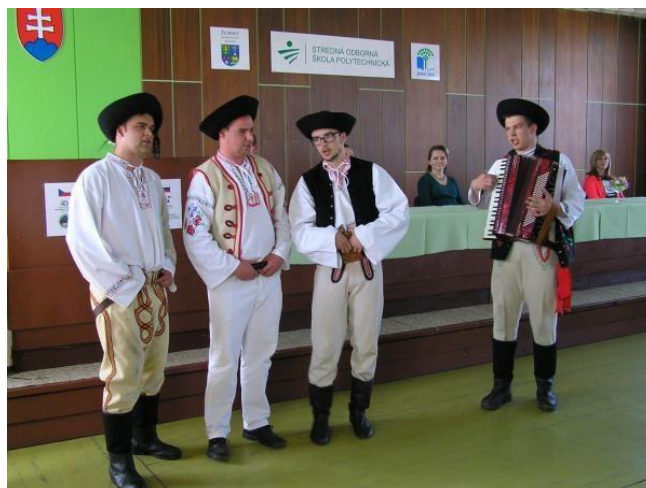
ILUSTRÁČNÉ FOTO : 22.IV.2016 FINÁLE V. ROČNÍKA INTERLIGY , SOŠP Liptovský Mikuláš