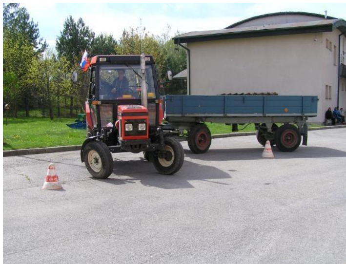
ILUSTRÁČNÉ FOTO : 22.IV.2016 FINÁLE V. ROČNÍKA INTERLIGY, SOŠP LIPTOVSKÝ MIKULÁŠ