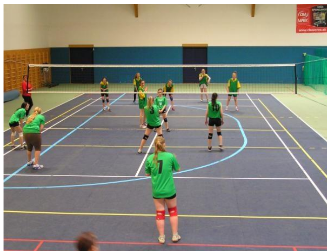
ILUSTRÁČNÉ FOTO : 22.IV.2016 FINÁLE V. ROČNÍKA INTERLIGY , SOŠP LIPTOVSKÝ MIKULÁŠ