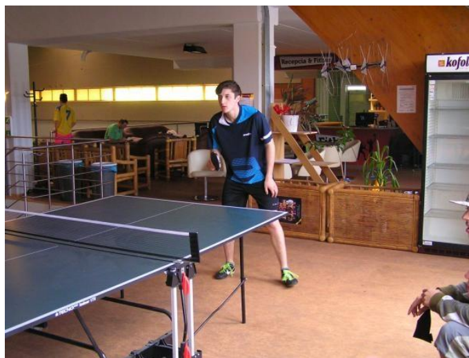
ILUSTRÁČNÉ FOTO : 22.IV.2016 FINÁLE V. ROČNÍKA INTERLIGY, SOŠP LIPTOVSKÝ MIKULÁŠ