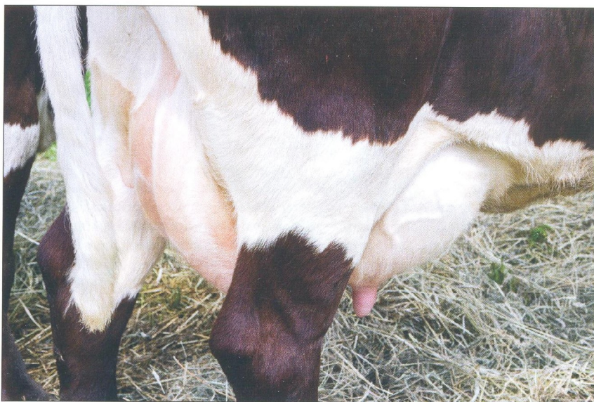
Najkrajšie vemenom výstavy patrí dojnici v 3. laktácii z PD Trsteník Trstená.