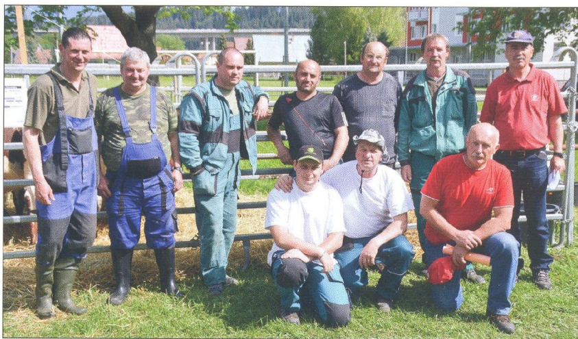
Veľkú zásluhu na úspechu chovateľského dňa majú vždy ošetrovatelia vystavovaných zvierat.

kú panvu. Aj keď mala slabšie utvárané vemenom (hlavne hrúbku a postavenie ceckov), ostatné prednosti zavážili a kvačianski družstevníci sa tak po štyroch rokoch mohli opätovne tešiť z titulu šampiónky. Prerušili tak trojročnú hegemoniu chovateľov z Liptovského Ondreja. Otcom tejto krásnej dojnice je slovenský býk NOBMON (NOB-004). Ten sa narodil v PD Rozkvet Odorín