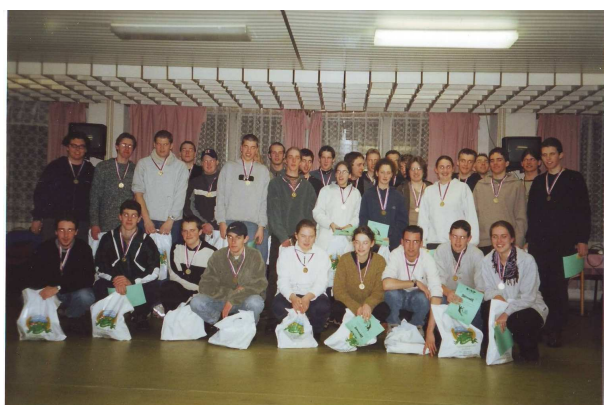
Študenti z Pito Stabroek po ukončení lyžiarskeho kurzu, ktorý zabezpečovala naša škola v roku 2001